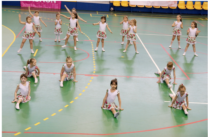
Widzowie mogli zobaczyć występ Klubu Tańca Sportowego „Atria”.