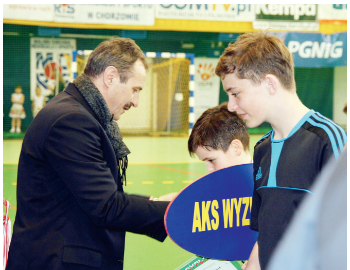
Gościem specjalnym był znakomity piłkarz Jan Furtok.