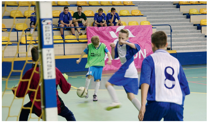
Niezwykle ciekawa była rywalizacja zespołów w grupie młodziej.