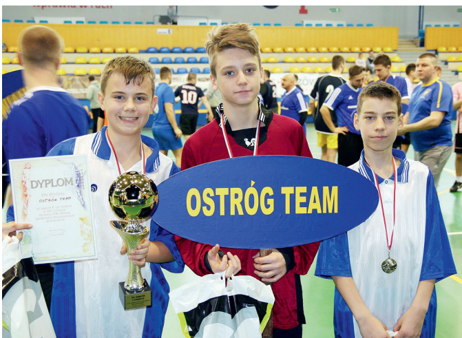
Wśród drużyn młodziej najlepszy okazał się Ostróg Team z Raciborza.