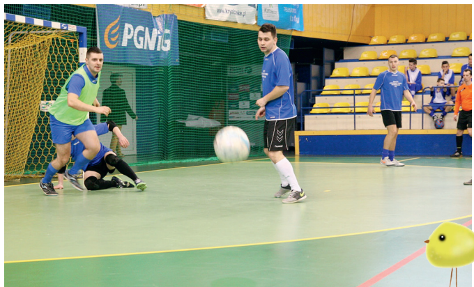
Turniej w grupie dorosłych zwyciężyła drużyna Hunger Bud.